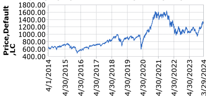
— UBS (Lux) Equity Fund - Small Caps USA (USD) P-acc