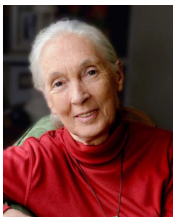
Jane Goodall PhD, DBE, Fondatrice de l'Institut Jane Goodall et messagère des Nations Unies pour la paix

En luttant contre la pollution atmosphérique, vous faites d'une pierre deux coups. Non seulement vous réduisez les risques pour la santé (ODD 3), mais vous vous attaquez également à la problématique du changement climatique (ODD 13). 4