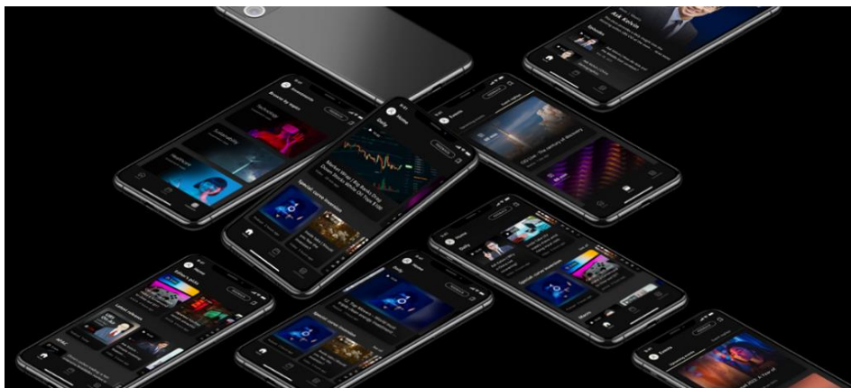
▲ UBS Circle One 應用程式內容包羅萬有，供客戶最新投資見解。

UBS Circle One 能讓客戶與專家、思想領袖及可行的想法聯繫起來，從而協助客戶實現獨特的財務目標。按照他們的喜好，客戶可從 UBS Circle One 獲取合適他們的投資見解及建議。